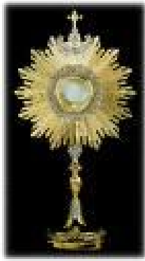
Die Römisch-Katholische Monstranz

Der Katholizismus hat diese Sichtbarmachung als die aktuelle „Gegenwart“ des wahren Körpers des Mashiach gelehrt. Millionen wurden dafür umgebracht, weil sie bestritten dass es so ist.